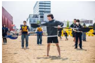
講義・ワークショップの様子