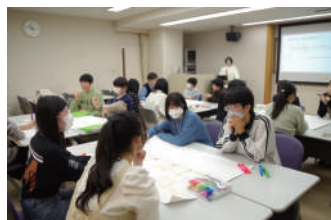
講義・ワークショップの様子